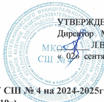
График организации питания МКОУ СШ № 4 на 2024-2025г 1 смена (08.00ч -13.10ч)